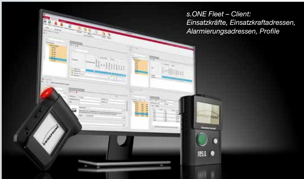
s.ONE Fleet – Client: Einsatzkräfte, Einsatzkraftadressen, Alarmierungsadressen, Profile

s.ONE Fleet ermöglicht ein schnelles Update und eine zentralisierte Verwaltung von Firmware und Pagerdaten wie zum Beispiel RIC-Adressen oder Schlüssel. Die Programmierung der Pager erfolgt dezentral per Fernkonfiguration. So ist sichergestellt, dass jeder Melder über seinen gesamten Lebenszyklus immer auf dem neuesten Stand ist. Die Software erlaubt die feingliedrige Zuordnung und Vergabe von Rechten und Rollen an die einzelnen Systemnutzer.